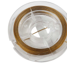
Schmuckdraht, Stärke: 0,38 mm, Gold, 10m 61585