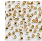
Quetschperlen, D: 2 mm, Vergoldet, 100Stck. 60106